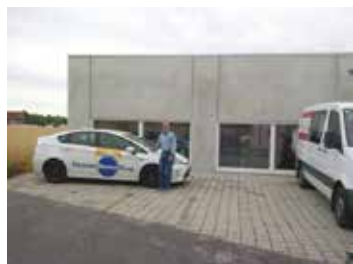
CaravanMoverShop Wiener Neustadt Anton Woller Gasse 4 AT-2700 Wiener Neustadt Tel: (+43) 012-53006560 Email: info@CaravanMoverShop.at

Mehr Informationen finden Sie auf unserer Website www.CaravanMoverShop.de