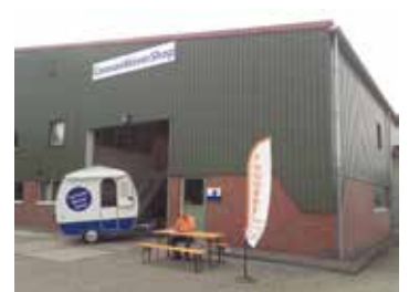
CaravanMoverShop Groningen Hoendiep 174-1 NL-9745 EA Groningen Tel: (+49) 030-88789334 Email: info@CaravanMoverShop.de