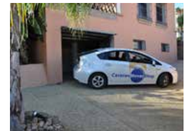
CaravanMoverShop Málaga Calle el Burgo 96 ES-29100 Coin, Málaga Tel: (+49) 030-88789334 Email: info@CaravanMoverShop.de